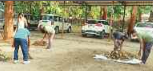
साफ सफाई करते पुलिस जवान।

ज्ञात हो कि स्वच्छता अभियान के तहत थाना परिसर को साफ सुथरा रखने थाना प्रभारी के नेतृत्व में रोजाना यहां साफ सफाई किया जाता है। उक्त कार्य के लिए यहां पदस्थ जवान खुद ही रोजाना बारी बारी से थाना परिसर की सफाई करते हैं। सबसे अहम बात यह रहती है इस कार्य के लिए थाना में पदस्थ सभी अधिकारी व कर्मचारी स्वच्छता से एक साथ कदम से कदम मिला छोटे बड़े का फर्क भूल एक